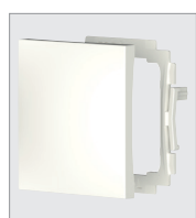
9080026, bascule simple