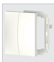
9080027, bascule double