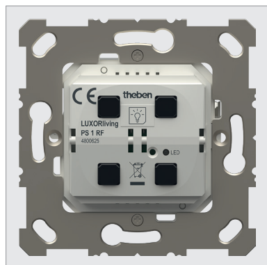
LUXORliving PS1 RF