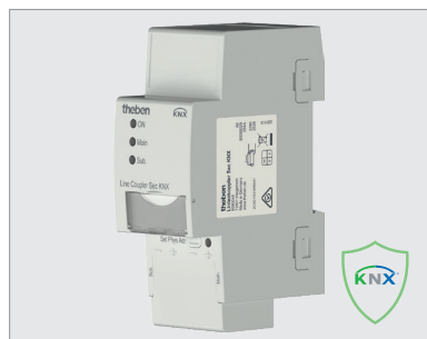
9080048, coupleur de lignes Sec KNX