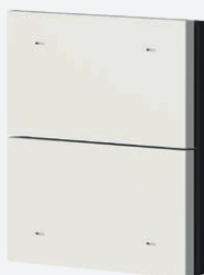
iONprime PB 2R PWH