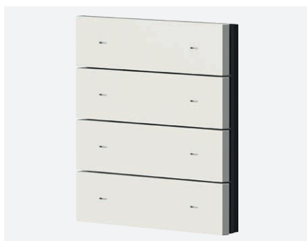
iONprime PB 4R PWH