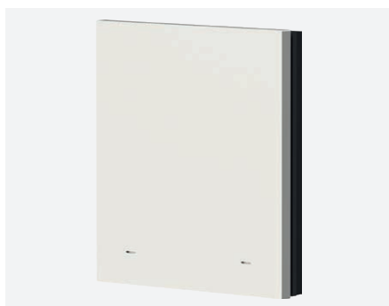
iONprime PB 1R PWH