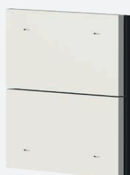
iONprime PB 2R PWH