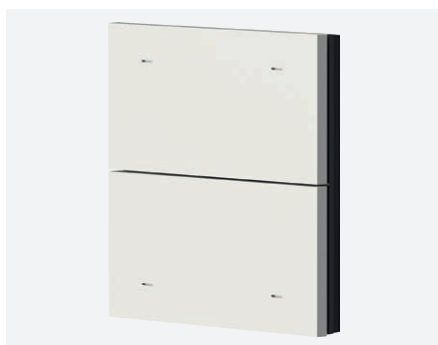
iONprime PB 2R MWH