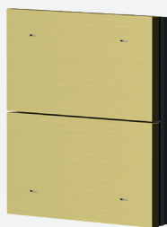
iONprime PB 2R MBR