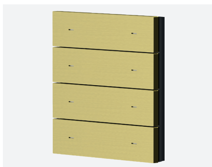
iONprime PB 4R MBR