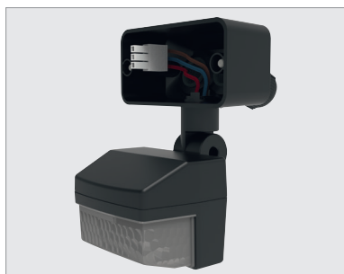
theLeda B dual sensor BK, module de détection de mouvement, à fixer sur le projecteur led theLeda B dual