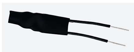
COMPENSATION MODULE LED