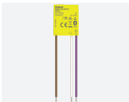
DIMAX 540 APP B