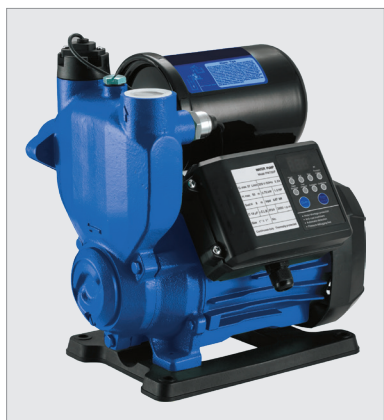
WIT APS55 D