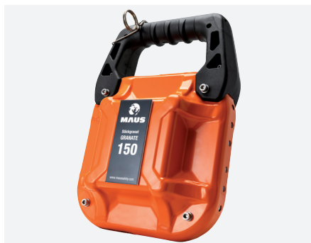
MAUS GRANATE 150