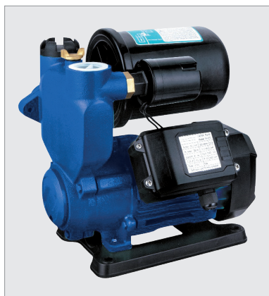
WIT APS55 A