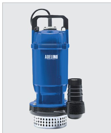
WIT QDX 10