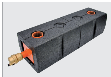
WIT BCP V DN32, livrée avec isolation