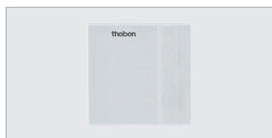
907.0.459, sonde de température IP65