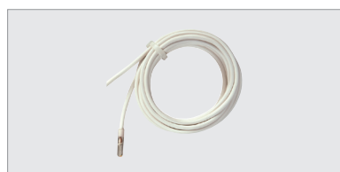
907.0.321, capteur de température sol IP65

*: sonde de température 907.0.321, 907.0.459 ou 907.0.496