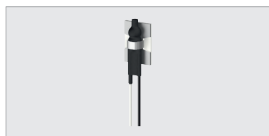
907.0.496, sonde de température encastrée