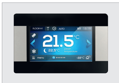
Écran tactile SAM3100 TS-Black