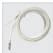
907.0.321, capteur de température sol, IP 65