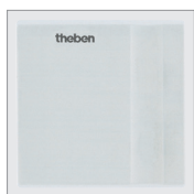
907.0.459, sonde de température ambiante, IP 65