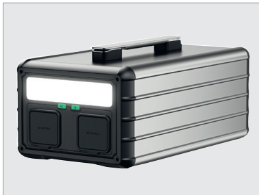
Met geïntegreerd ledlamp aan de achterkant