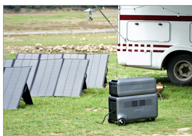
Met draagbare zonnepanelen ZENDURE