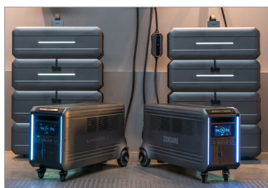
Max. 2x ZEN-SuperBase V6400 en 8x ZEN-SuperBase 6400 battery voor een totale capaciteit van 64 kWh