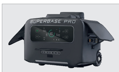
ZEN-SuperBase Pro bag, stofhoes met opbergvak voor oplaadkabels en accessoires