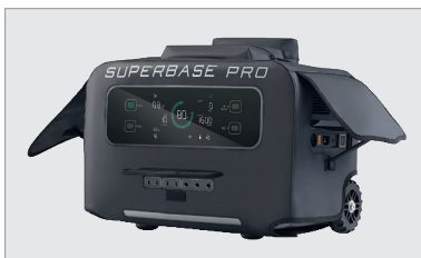
ZEN-SuperBase Pro bag, stofhoes met opbergvak voor oplaadkabels en accessoires