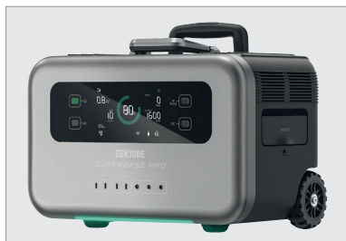
ZEN-SuperBase Pro 1500