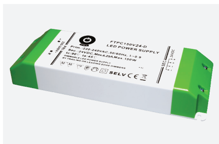
MPL-FTPC150V24-D (150 W)