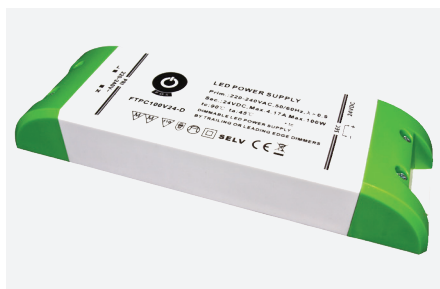
MPL-FTPC100V24-D (100 W)