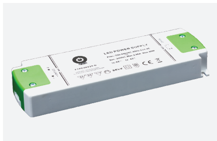
MPL-FTPC50V24-D (50 W)