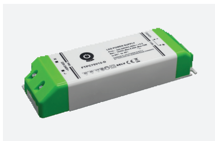
MPL-FTPC75V24-D (75 W)