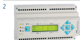
Centrale de détection RYM02M1