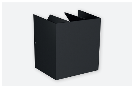
ID571226FSC (gestructureerd antraciet grijs)