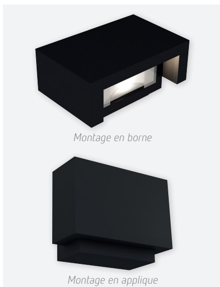
IDTL941051NSC (noir structuré)