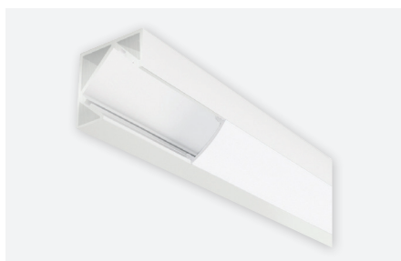
IDTL588322BSZ (2 m - blanc)