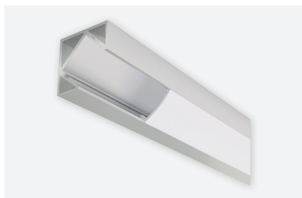
IDTL588022AAZ (2 m - aluminium)