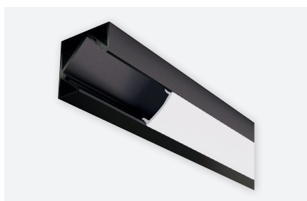
IDTL588422NSZ (2 m - noir)