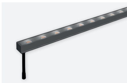
IDTL554001NZE (3.000 K - IP67 - 50 cm) IDTL554002NZE (3.000 K - IP67 - 100 cm)