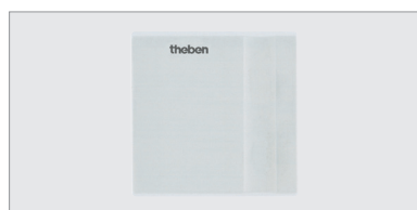
907.0.459, sonde d'ambiance IP65