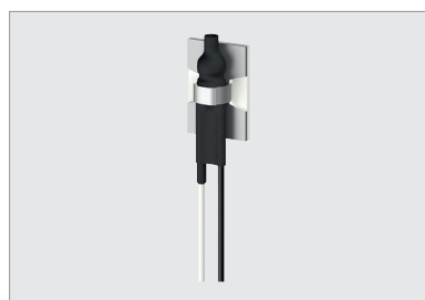
907.0.496, capteur de température encastré