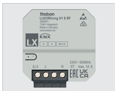
LUXORliving H1 S RF