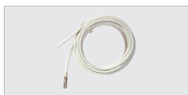
907.0.321, sonde sol