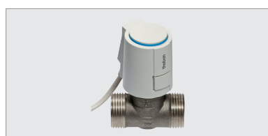
ALPHA5 230V, servomoteur