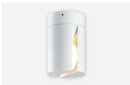
IDTL941040BSC (gestructureerd wit)