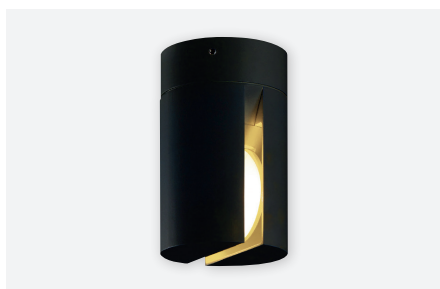
IDTL941041NSC (gestructureerd zwart)