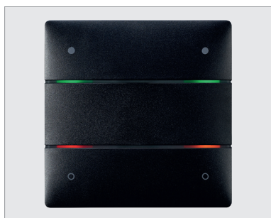
LUXORliving iON4 BK