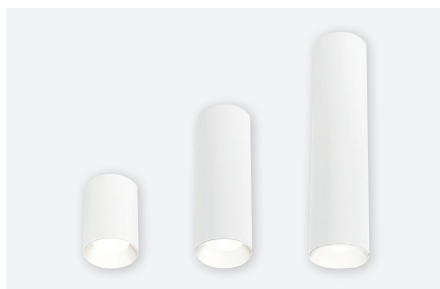
IDTL982011BSZ (blanc structuré - 10 cm) IDTL982021BSZ (blanc structuré - 20 cm) IDTL982031BSZ (blanc structuré - 30 cm)