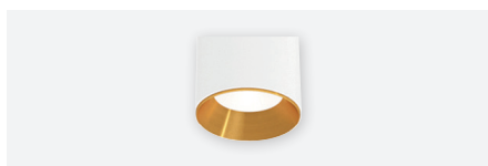
IDTL988003JSZ (bague de finition dorée)