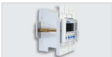
907.0.001, kit pour montage encastré