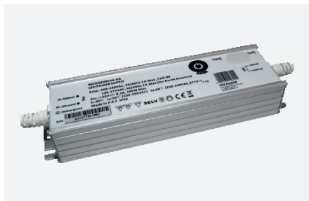
MPL-MCHQ200V24-GA (200 W - PFC)