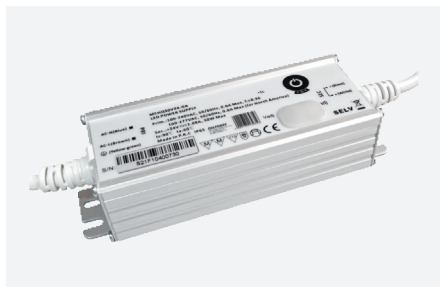
MPL-MCHQ50V24-GA (50 W - PFC)