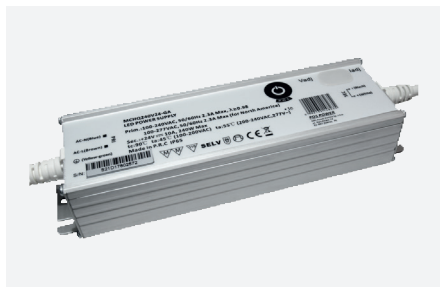
MPL-MCHQ240V24-GA (240 W - PFC)