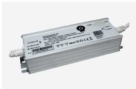
MPL-MCHQ150V24-GA (150 W - PFC)