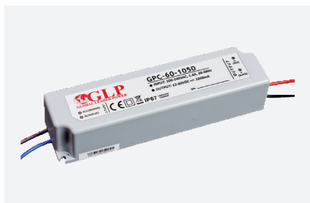
MPL-GPC-60-1050 (63 W - 1.050 mA)