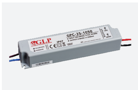
MPL-GPC-35-1050 (31,5 W - 1.050 mA)