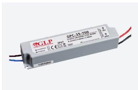
MPL-GPC-35-700 (33,6 W - 700 mA)