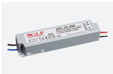
MPL-GPC-35-350 (28 W - 350 mA)