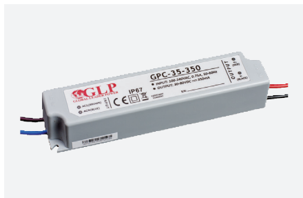
MPL-GPC-35-350 (28 W - 350 mA)