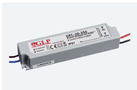
MPL-GPC-20-350 (16,8 W - 350 mA)