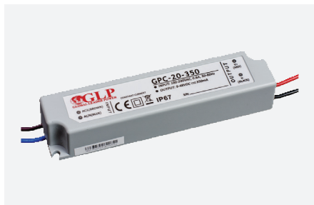
MPL-GPC-20-350 (16,8 W - 350 mA)