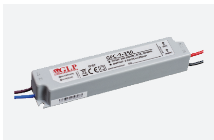
MPL-GPC-9-350 (8,4 W - 350 mA)