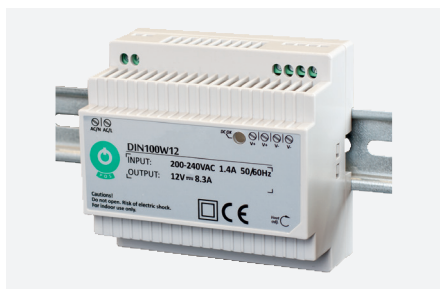
MPL-24VDC-DIN100W (100 W)