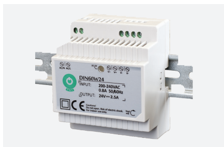
MPL-24VDC-DIN60W (60 W)